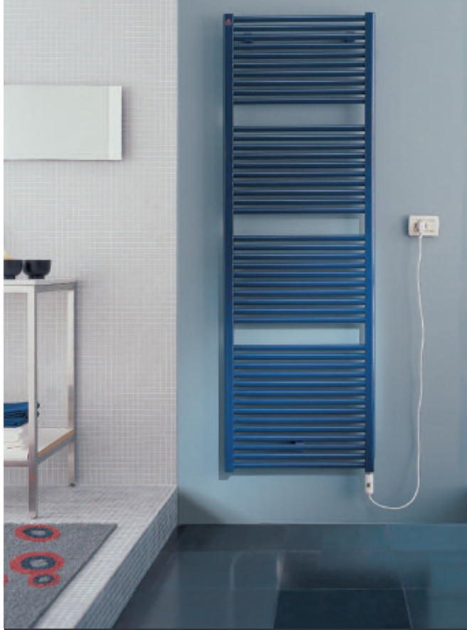
In foto: Radiatore Novo Elettrico. Altezza mm 1808, larghezza mm 600, colore Blu Hewi (cod. 11)- resistenza con interruttore.