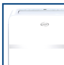
Cura dei dettagli Attention to details