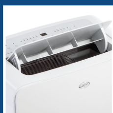
Flap motorizzato Auto-opening flap