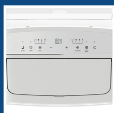
Pannello comandi digitale con display a LED Digital control panel with LED display

ARGO ORION is the air conditioner with a contemporary design. The glossy front panel, highlighted by a silver band, is the results of fashion and interior design contaminations.