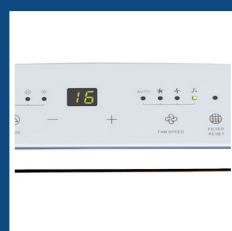
Pannello comandi digitale con display a LED Digital control panel with LED display

"Filter reset" function guarantees excellent air quality, the air conditioner indicates when to clean the air filter.