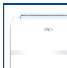
Cura dei dettagli Attention to details