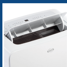
Flap motorizzato Auto-opening flap